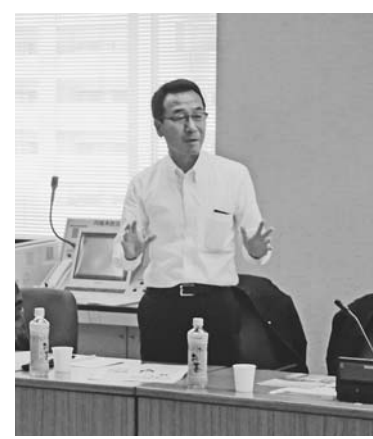
8月3日 民主県政会県内調査