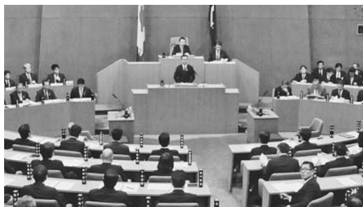
会場一般質問(本会議場)

原爆投下の惨劇は、私たちに、平和への責任を問い続けている。「5・27」が核廃絶の一里塚であったと歴史に刻むための行動が必要だ。今出来ることを、一つずつ。一歩ずつ。